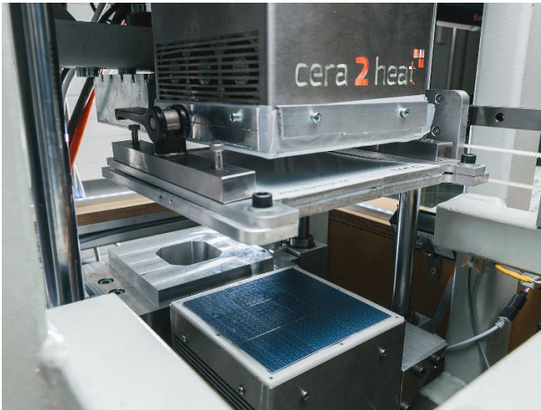
Abbildung: Matrixheizer cera2heat®

Die patentierte Heiztechnologie eignet sich für alle Anwendungen, die eine punkt-, temperatur- und zeitgenaue Erwärmung erfordern.